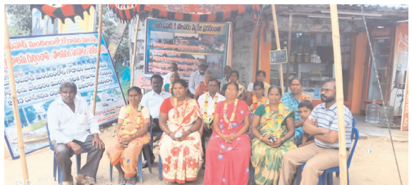
%&%ఆర్ పరిహారం” అందించాలని లేదా పోలవరం ప్రాజెక్టు

బూర్గంపాడు, సెప్టెంబర్ 30 (విజయం న్యూస్): బూర్గంపాడు మండలంలోని గోదావరి వరద బాధిత గ్రామాలను పోలవరం ముంపు గ్రామాల గుర్తించి “2013 భూసేకరణ చట్టం ప్రకారం ఆర్