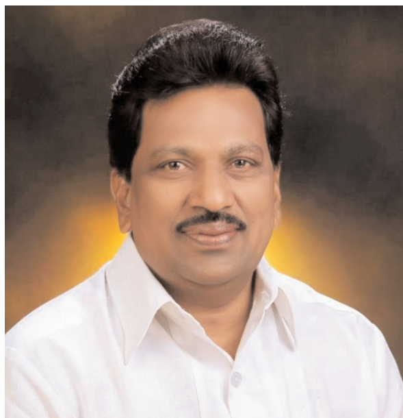
ఉద్యమాలకు తీరని లోటని తెలిపారు. వారి మృతికి సిపిఎం ఖమ్మం జిల్లా కమిటీ ప్రగాఢ సంతాపం, కుటుంబానికి సానుభూతిని తెలియ జేశారు.