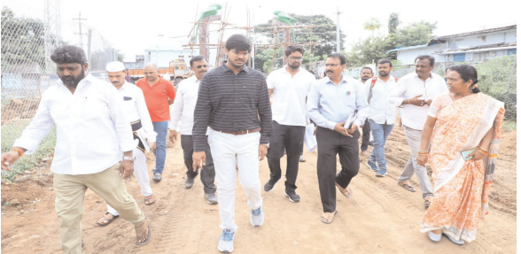
తనిఖీలు చేశారు. పంపింగ్ వెల్ రోడ్, రంగనాయకులు గుట్ట, సుందరయ్య నగర్ లో చేపడుతున్న పనులను ఆయన పరిశీలించారు.