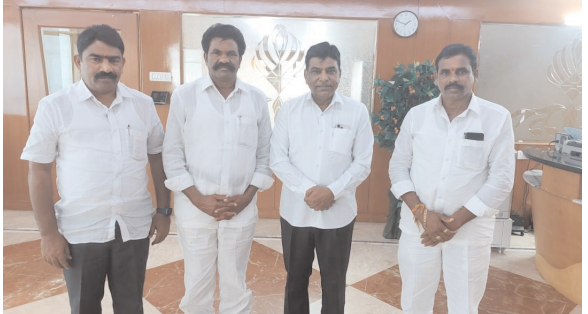
అభిదారులకు నగదు బదిలీ రూపేనా మంజూరు చేయాలని, తద్వారా అభిదారుడు ఇష్టమైన గొర్రెలను కొనుగోలు చేసుకునే అవకాశం

ఖమ్మంప్రతినిధి-విజయంన్యూస్: తెలంగాణ ప్రభుత్వం యాదవుల కోసం ప్రతిష్టాత్మకంగా ప్రవేశపెట్టిన గొర్రెల పంపిణీ పథకాన్ని యాదవులకు,