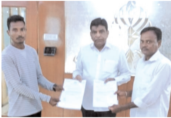
సేవకు నిలువెత్తు నిదర్శనంగా చెప్పవచ్చు. కష్టాల్లో ఉన్న వారికి చేతనైనంత సాయం చేయడంలో ఉన్న ఆత్మ సంతృప్తి మరెందులోనూ లభించలేదన్నారు. తద్వారా జీవితానికి ఆనందం, తృప్తి కలుగుతుందని నామ స్పష్టం చేశారు.

కారేపల్లి అక్టోబర్ 13 (విజయం న్యూస్): కష్టాల్లో ఉన్న వారికి చేతనైనంత సాయం చేయడంలో ఉన్న ఆత్మ సంతృప్తి మరెందులోనూ లేదని ఎంపీ నామా నాగేశ్వరరావు అన్నారు. మానవ జీవితానికి పరమార్థానిచ్చే ఎన్నో సామాజిక కార్యక్రమాలతో ప్రశంసలందుకుంటున్న నామ, అడిగిన వారికి కాదనకుండా చాతనైనంతా సాయం చేయడం ఆయనలోని సహజ మానవ నైజత్వమని మనందరికీ తెలిసిందే. సీఎంఆర్ఎఫ్ ద్వారా నేనున్నాంటూ పేదలకు పెద్ద ఎత్తున భరోసా ఇస్తున్నారు.. తాజాగా కష్టాల్లో ఉండి, మెరుగైన వైద్యం చేయించుకోలేని ముగ్గురికి ఒక్కొక్కరికి రూ. 2.50 లక్షల చొప్పున మొత్తం రూ. 7 లక్షల 50 వేల విలువైన మూడు ఎల్ వోసీలు మంజూరు చేయించిన ఘనత నామది. అదీనూ ఒకే కుటుంబంలో ఇద్దరికి రూ.5 లక్షల విలువైన రెండు ఎల్వోసీలు మంజూరు చేయించడం ఆయనలోని మానవత్వానికి మచ్చు తునక. సింగరేణి మండలం గిద్దవారిగూడెం గ్రామానికి చెందిన బి. గీతాబాయికి రూ. 2.50 లక్షలు, ఆమె కుమారుడు బి. రాజేందర్ కు రూ. 2.50 లక్షల విలువైన మరో ఎల్వోసీని మంజూరు చేయించడం ఆయనలోని మానవ