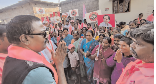
మునుగోడులో టీఆర్ఎస్ కు కోదాడ లాల్ ఓనర్స్ అసోసియేషన్ మద్దతు

సందర్భంగా ప్రభుత్వ పథకాలను ప్రజలకు చేరువ చేయడమే కాకుండా వాటి పట్ల ప్రజలకు విస్తృత అవగాహన కలిగించాలని శ్రేణులకు మంత్రి పిలుపునిచ్చారు. టీఆర్ఎస్ అభ్యర్థి కూసుకుంట్ల ప్రభాకర్ రెడ్డి గెలుపు ఎప్పుడో ఖరారు అయిందని, మెజార్టీ కోసమే ప్రచారం చేస్తున్నామని మంత్రి పువ్వాడ అజయ్ కుమార్ వెల్లడించారు.