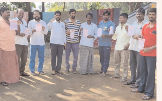
పోరాటాలు కొనసాగిస్తుందని ఎన్నో త్యాగాలతో సాధించుకున్న వివిధ రకాల చట్టాలను రాష్ట్ర కేంద్ర ప్రభుత్వాల నిర్దిష్టం చేస్తూ బిజిబి మోడీ ప్రభుత్వం 2022 నూతన అటవీ సంరక్షణ