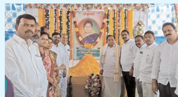
(ఖమ్మం, వైరా) - విజయం న్యూస్