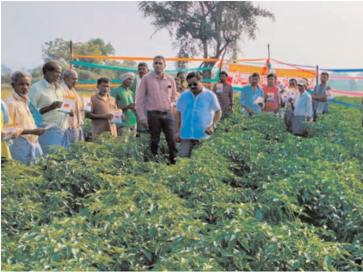
ములుగు జిల్లా ప్రతినిధి డిసెంబర్ 15 (విజయం న్యూస్):-