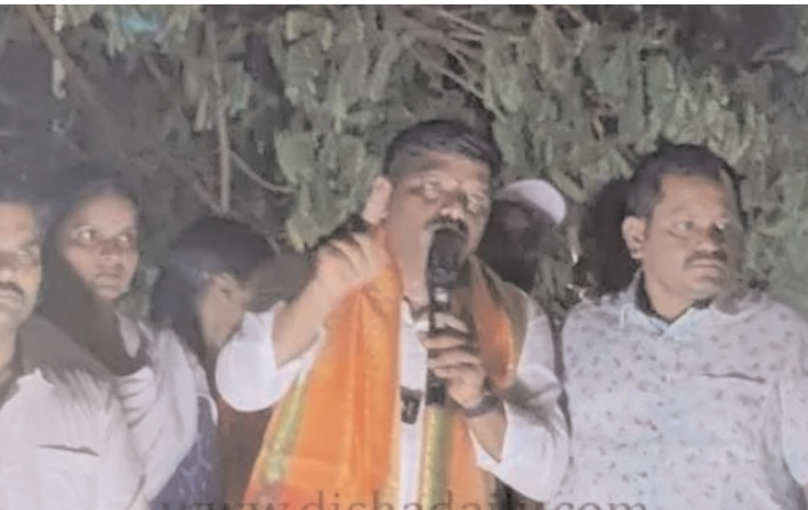
మణుగూరు డిసెంబర్ 14 (విజయం న్యూస్):