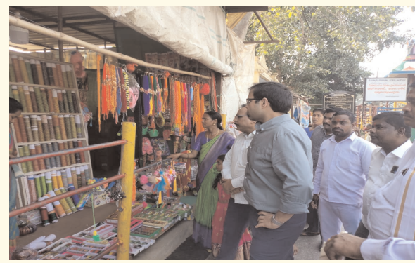
తాడ్యాయి డిసెంబర్ 15 (విజయం న్యూస్): -

మేడారంలో పూజారులు, అధికారులతో సమీక్ష. మనదేవతలకు మొక్కులు చెల్లించు. ఐ టి డి ఎ పి ఓ అంకిత్.