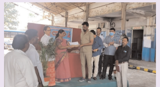
మణుగూరు డిసెంబర్ 14 (విజయం స్టాన్):