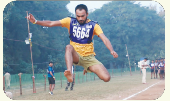
(ఖమ్మం ప్రతినిధి-విజయం న్యూస్)

9వరోజు హాజరైన 980 మంది పురుష అభ్యర్థులు తుది పరీక్షలకు అర్హత సాధించిన 626 మంది అభ్యర్థులు