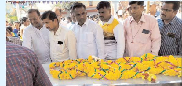
అశ్వాపురం, డిసెంబర్ 19, (విజయం న్యూస్)