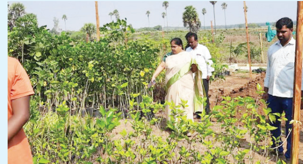
ఏస్కూర్, డిసెంబర్ 19 (విజయం న్యూస్)