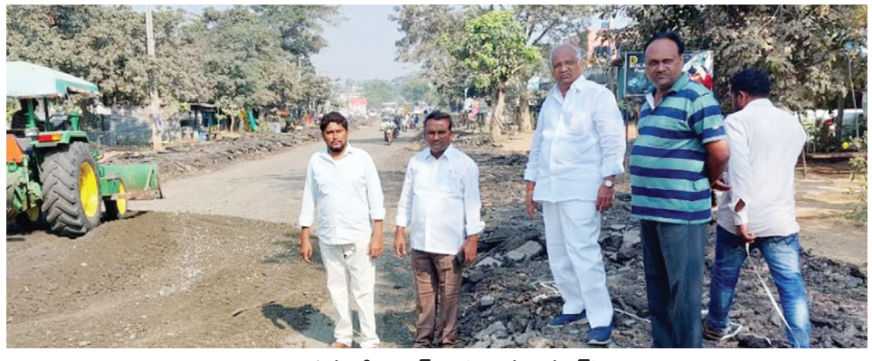
అశ్వాపురం డిసెంబర్ 1 (విజయం న్యూస్)