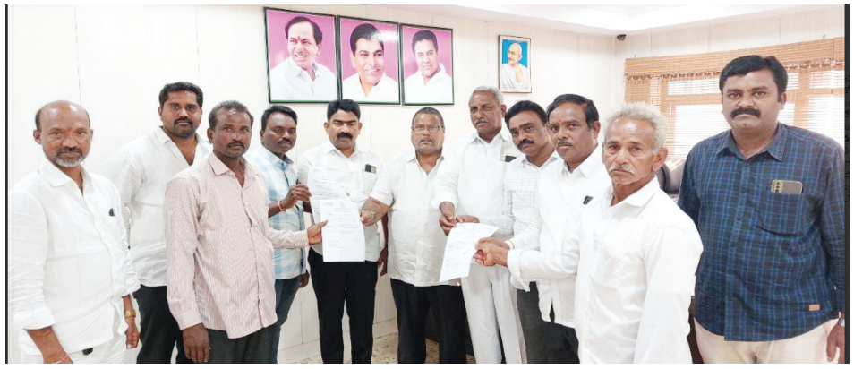
ఖమ్మం, డిసెంబర్ 19 (విజయం న్యూస్):