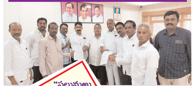
బాధితులకు ఎల్వోవోసీ అందజేస్తున్న డ్యుశ్యం

-నామాలో పరిమళించిన మానవత్వం -నలుగురికి రూ.7 లక్షల విలువైన ఎల్వోవోసీ చెక్కులు -చిన్నారి వైద్యానికి ఎల్వోవోసీ మంజూరు