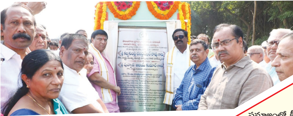
ఖమ్మం, డిసెంబర్ 19(విజయంన్యూస్):

-ప్రజలందరూ సుఖసంతోషాలతో ఉండటమే నా లక్ష్యం -వెలుగుమట్లలో అపరకర్మ భవన నిర్మాణ పనులకు శంకుస్థాపన చేసిన మంత్రి పువ్వాడ