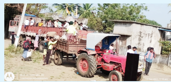
ఏస్కూర్, డిసెంబర్ 19 (విజయం న్యూస్)

మండలంలో సాగుచేసిన మిర్చి కోతలకు సమయం దగ్గర పడడంతో వలస కూలీలను రప్పించేందుకు రైతులు సన్నాహాలు చేస్తున్నారు. ప్రతి ఏటా మిర్చి కోతలకు మధ్యప్రదేశ్, ఒరిస్సా, మహారాష్ట్ర, చత్తిస్గడ్ రాష్ట్రాల నుంచి పెద్ద ఎత్తున వలస కూలీలు ఏస్కూర్ మండలానికి వస్తుంటారు. గత ఏడాది సుమారు 15 వేల మంది వరకు వచ్చారు. మండలంలో సుమారు 8 వేల ఎకరాల్లో మిర్చి సాగు చేశారు. ఎకరానికి సుమారు లక్ష రూపాయల వరకు పెట్టుబడులు పెట్టారు. తీరా పంట కాపు కోస్తున్న తరుణంలో ఎర్రనల్లి తామర పురుగు ఉధృతంగా వ్యాపించడంతో దిగుబడులు తగ్గుతాయి అని రైతులు ఆవేదన వ్యక్తం చేస్తున్నారు. సాధారణంగా ఎకరానికి 30 కింటాళ్లు వరకు దిగుబడులు వస్తాయి. అయితే తెగుళ్లు సోకిన ఫలితంగా దిగుబడులు సగానికి తగ్గే అవకాశాలు ఉన్నాయని రైతులు వాపోతున్నారు. ఇది ఇలా ఉంటే మరికొద్ది రోజుల్లోనే మిర్చి కోతలు వస్తుండడంతో వలస కూలీలు సైతం ఇప్పుడిప్పుడే మండలానికి వస్తున్నారు. వలస కూలీలను తీసుకొచ్చేందుకు రైతులు ప్రయత్నాలు చేస్తున్నారు.