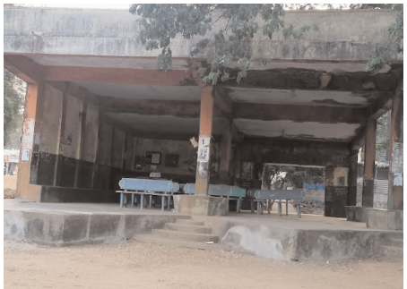
నూగురు వెంకటాపురం/డిసెంబర్ 29/విజయం న్యూస్:-