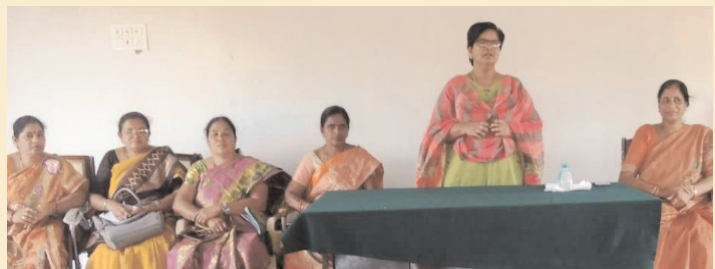
కారేపల్లి డిసెంబర్ 29 (విజయం న్యూస్):