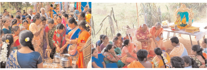
ఏనుగురు, డిసెంబర్ 29 (విజయం న్యూస్) ఏనుగూర్ లోని శ్రీ వంద్యురాలి పోతులూరి వీరబ్రహ్మేంద్రస్వామి దేవాలయంలో ప్రథమ వార్షికోత్సవ

-ముగిసిన వార్షికోత్సవ పూజలు -ఘనంగా అన్నదానం