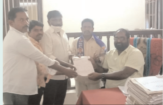
వెంకటాపురం/డిసెంబర్ 29/విజయం న్యూస్:-