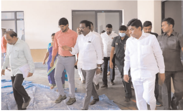
ఖమ్మం, జనవరి 11(విజయంన్యూస్):