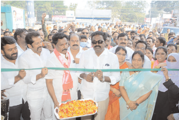
(ఖమ్మం ప్రతినిధి-విజయం న్యూస్)

ఖమ్మం సిటీ బస్ స్టాండ్ ను ప్రారంభించిన మంత్రి పువ్వాడ ధన్యవాదాలు తెలుపుతూ మంత్రిని సన్మానించిన వ్యాపారులు, ప్రయాణికులు