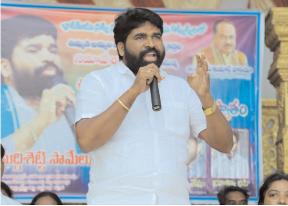
చంద్రగోండ విజయం న్యూస్ ( జనవరి 21)

బిఎస్ఎస్ఎమ్ చైర్మన్ మద్దిశెట్టి సామెలు డిమాండ్