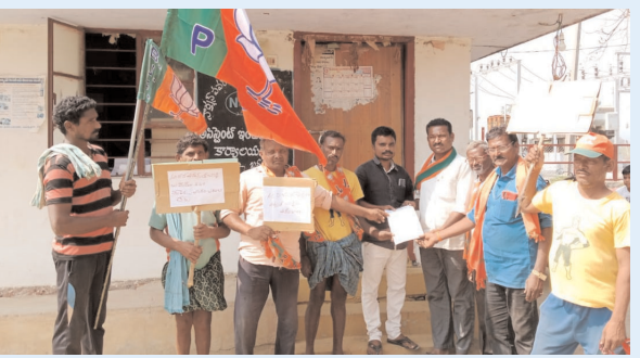
వినూరు, జనవరి 21 (విజయం న్యూస్)