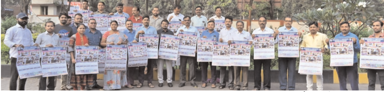
మణుగూరు జనవరి 21 (విజయం న్యూస్)