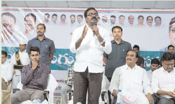
(భద్రాద్రి కొత్తగూడెం-విజయం న్యూస్)