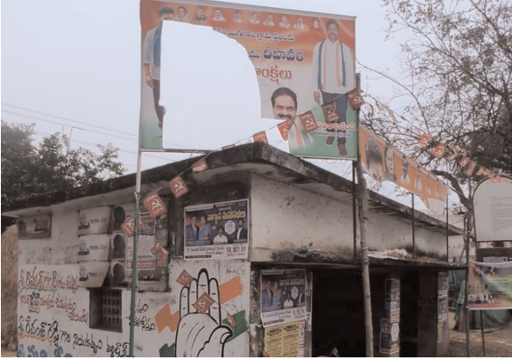
తిరుమలాయపాలెం, జనవరి 5 (విజయం న్యూస్)