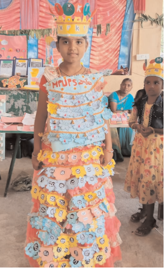
(కూసుమంచి పాలేరు) -