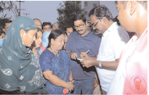
(ఖమ్మం ప్రతినిధి - విజయం న్యూస్)

అనేక సమస్యలు తక్షణ పరిష్కారం.. సుదీర్ఘ సమస్యలు సైతం తక్షణ పరిష్కారం అవడం పట్ల హర్షం వ్యక్తం చేస్తున్న ప్రజలు.