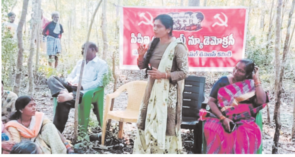
బార్గంపహాడ్, డిసెంబర్ 06