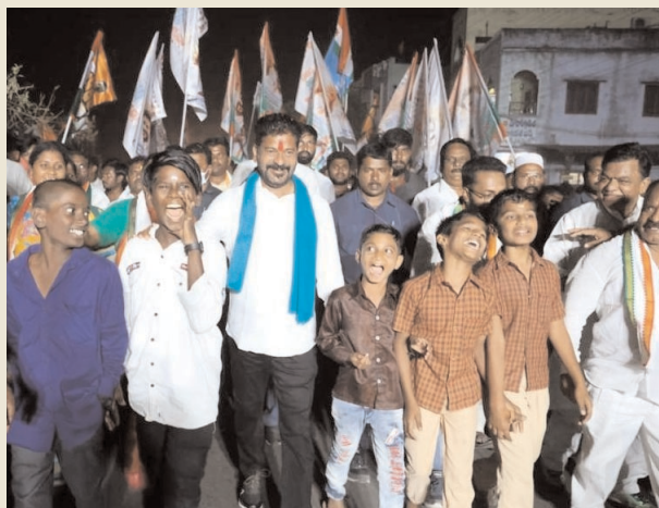
(మణుగూరు/ఖమ్మం ప్రతినిధి-విజయం న్యూస్)