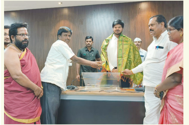
ఖమ్మం/పెనుబల్లి, ఫిబ్రవరి, 13(విజయం న్యూస్)