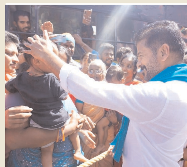
9గంటలకు యాత్ర ప్రారంభం కాగా అశ్వాపురం నుంచి మణుగూరు వరకు పాదయాత్ర కొనసాగింది.

అనూహ్య స్పందన.. అడగడుగున నిరాజనాలు రేవంత్ రెడ్డి పాదయాత్రకు పినపాక నియోజకవర్గంలో అనూహ్య స్పందన లభించింది. పినపాక నియోజకవర్గంలోని అన్ని మండలాలతో పాటు భద్రాద్రి కొత్తగూడెం జిల్లాకు చెందిన వేలాది మంది జనం, కార్యకర్తలు, అభిమానులు తరలివచ్చారు. దీంతో పాదయాత్ర ద్వారా వచ్చే రహదారి జనంతో నిండిపోయింది. సుమారు రెండు, మూడు కిలోమీటర్ల పాటు జనం కనిపించారు. అలాగే రేవంత్ రెడ్డి పాదయాత్ర చేస్తుండగా జనాలు నిరాజనాలు పలికారు. అడుగడుగున ఆయనకు ఘనస్వాగతం పలికారు. ప్రజలు రేవంత్ రెడ్డిని చూసేందుకు ఎగబడ్డారు. రేవంత్ రెడ్డి కూడా ఓపికగా అందర్ని కలుస్తు, అభిమానులతో మాట్లాడుతూ, ప్రజలను కలుస్తు వారి సమస్యలను తెలుసుకుంటూ ముందుకు సాగారు.