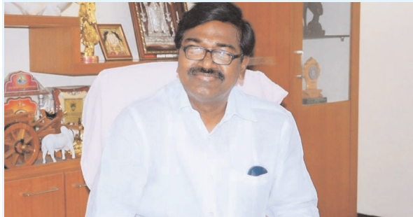
(ఖమ్మం ప్రతినిధి-విజయం న్యూస్)

- ఈ ఆర్థిక సంవత్సరంలో సీతారామ ప్రాజెక్టు ను పూర్తి చేసి ఖమ్మం జిల్లాను సస్యశ్యామలం చేస్తాం రాష్ట్ర రవాణాశాఖమంత్రి మంత్రి అజయ్ కుమార్