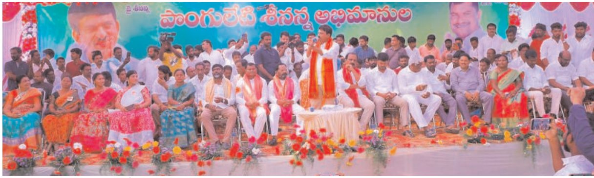
(అభ్యుదయ పేట-విజయం న్యూస్)

భద్రాద్రి కొత్తగూడెం జిల్లా దమ్ముపేట మండల కేంద్రంలోని నెమలిపేట గ్రాండ్లో జరిగిన పాంగులేటి శీనన్న ఆత్మీయ సమ్మేళనంలో ఖమ్మం మాజీ ఎంపీ పాంగులేటి శ్రీనివాసరెడ్డి బీఆర్ఎస్ పార్టీపై సంవలన వ్యాఖ్యలు చేశారు. బీఆర్ఎస్ ప్రభుత్వంలో నిరుద్యోగులకు, గిరిజనులకు, ఏజెన్సీ గ్రామాల్లో ఉన్న గిరిజనేతరులకు ఇల్లు లేని వారికి ఎలాంటి లాభం చేకూరలేదని, అక్కడక్కడ పది, పదిహేను ఇళ్ళు కట్టి భూతర్షణలో చూపిస్తున్నారని, రాష్ట్ర ప్రభుత్వం చేసిన కార్యక్రమాల గురించి ప్రభుత్వం ఆత్మపరిశీలన చేసుకోవాలని సూచించారు. పోడు భూములకు, ఏజెన్సీలోని గిరిజనేతరులకు భూములకు పట్టాలిస్తామని, నిరుద్యోగులకు నిరుద్యోగ భృతి ఇస్తామని చెప్పిన రాష్ట్ర ముఖ్యమంత్రి కేసీఆర్ ఆ ఊస్ ఎత్తకపోవడం బాధాకరం అన్నారు. కనీసం గ్రామపంచా యితీలకు నిధులు ఏర్పాటు చేయకపోవడం, పెండింగ్ బిల్లులను విడుదల చేయకపోగా, మళ్ళీ ఒక్కో గ్రామపంచాయితీకి పది లక్షలు, మున్సిపాలిటీకి రూ. 30 లక్షలు ఇస్తామని చెప్పడం హాస్యాస్పదం అని వ్యాఖ్యానించారు. సర్పంచేలు తమ భార్యల మెడలో బంగారాన్ని తాకట్టు పెట్టి పంచాయితీలకు ఖర్చు చేయాల్సిన పరిస్థితి నెలకొందన్నారు.