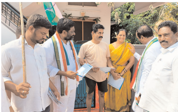
(ఖమ్మం ప్రతినిధి-విజయం న్యూస్)

-హాత్ సే హాత్ ప్రారంభంలో జిల్లా, నగర కాంగ్రెస్ అధ్యక్షులు -జోడో యాత్ర స్ఫూర్తితో హాత్ సే హాత్ యాత్ర