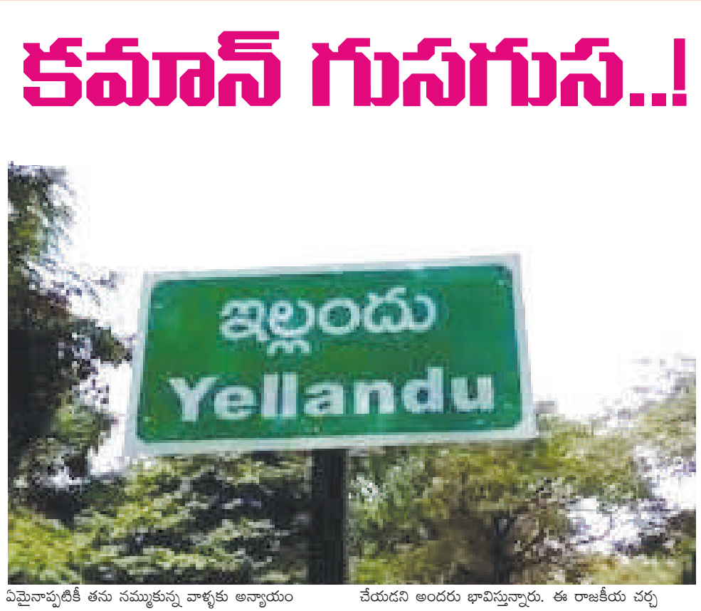
ఏమైనాప్పటికీ తన సమ్మతున్న వాళ్ళకు అన్యాయం చేయడని అందరు భావిస్తున్నారు. ఈ రాజకీయ చర్చ