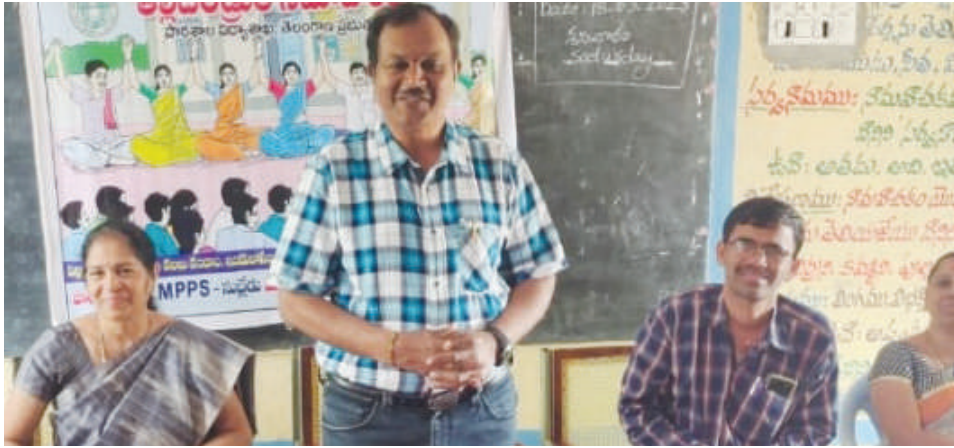
తిరుమలాయపాలెం, మార్చి 18 (విజయం న్యూస్)