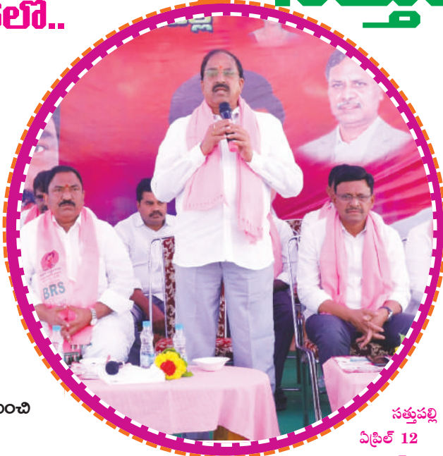
సత్తుపల్లి ఏప్రిల్ 12 (విజయం న్యూస్) :

సత్తుపల్లి ని తెలంగాణ రాష్ట్రంలో రోల్ మోడల్ గా తీర్చిదిద్దామని మాజీ మంత్రి తుమ్మల నాగేశ్వరరావు అన్నారు.