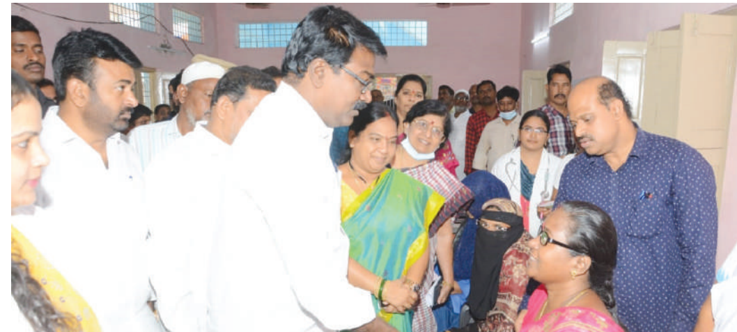
దృష్టి లోపాన్ని సరిచేయడానికి రాష్ట్ర ప్రభుత్వం ప్రతిష్టాత్మకంగా అమలు చేస్తున్న