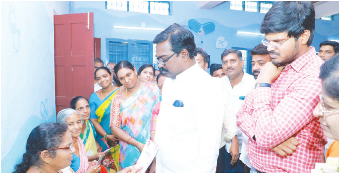
(ఖమ్మం ప్రతినిధి-విజయం న్యూస్)

నగరంలోని 25వ డివిజన్ నందు ఎర్పాటు చేసిన కంటి వెలుగు శిబిరాన్ని ప్రారంభించిన మంత్రి పువ్వాడ