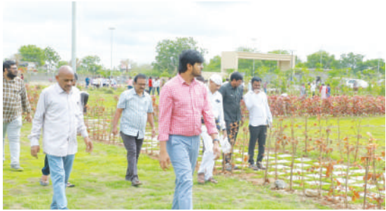
తెలిపారు. ఈ సందర్భంగా ఐడిఓసి లో నాటిన మొక్కల వద్ద నున్న కలుపు, పిచ్చి మొక్కలను అధికారులు, సిబ్బంది తో కలిసి కలెక్టర్ తొలగించారు. పాల్గొన్న వివిధ శాఖల అధికారులు, సిబ్బందిని కలెక్టర్ అభినందించారు. ఇదే సూర్తిని కొనసాగించాలని ఆయన తెలిపారు. ఈ

చేసుకుంటూ, వాటిని కాపాడుకోవాలన్నారు. అనంతరం కలెక్టర్ ఐడిఓసి లోని వివిధ కార్యాలయాలు పరిశీలించి, సూచనలు చేశారు. ప్రతి కార్యాలయం తప్పనిసరిగా ఈ-ఆఫీస్ ద్వారా పైక్ష నిర్వహణ చేయాలన్నారు. ఈ-ఆఫీస్ తో పైక్ష నిర్వహణ సులభతరమే కాక, సురక్షితంగా వుంటాయని ఆయన తెలిపారు. పాత