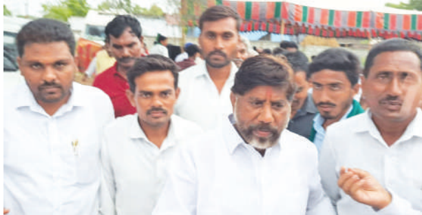
100వ రోజు పాదయాత్ర కొనసాగుతుంది. సీఎల్పీ నేత భట్టి