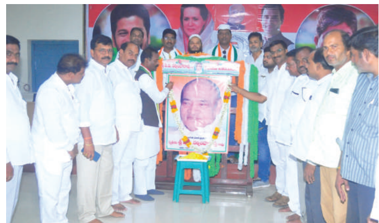
తీసే స్థాయికి చేరుకున్న ఆర్థిక వ్యవస్థకు పునర్ద్దీపం కల్పించేందుకు సంస్కరణలకు బీజం వేశాడు అని అన్నారు. తన ఆర్థిక మంత్రి మన్మోహన్ కు స్వేచ్ఛను ఇచ్చి సంస్కరణలకు శ్రీకారం చుట్టారని తెలిపారు. అంతే కాకుండా పంజాబ్ తీవ్ర వాదాన్ని విజయవంతంగా అణచివేసిన ఘనత కూడా పీవీ కే దక్కతుందని అన్నారు. పీవీ ని స్ఫూర్తిగా తీసుకుని ముందుకు వెళ్లాలని కార్యకర్తలకు సూచించారు. కార్యక్రమంలో వీరితో పాటు ఖమ్మం నియోజకవర్గ పీసీసీ సభ్యులు జిల్లా ఓబీసీ సెల్ అధ్యక్షులు