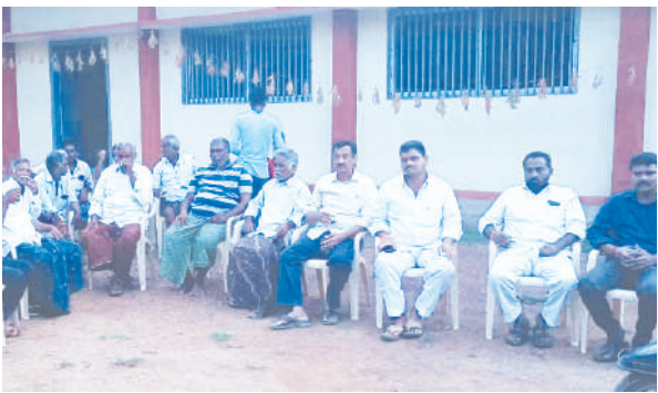
ప్రజలకు అందిస్తున్న అభివృద్ధి సంక్షేమ పథకాలను ప్రజల్లోకి తీసుకువెళ్లి వారిని చైతన్య పరచాలన్నారు, ప్రభుత్వం నుండి ప్రతి కుటుంబానికి సంక్షేమ పథకాలు అందాయని పేర్కొన్నారు