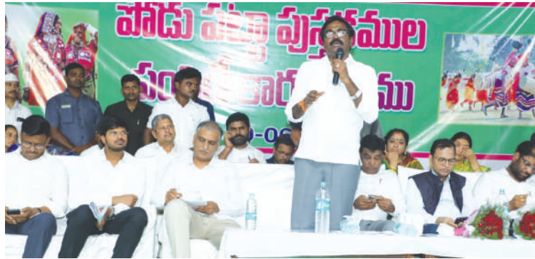
కొనియాడారు. అంతే కాకుండా తెలంగాణ రాష్ట్ర ప్రభుత్వం పట్టణ పంపిణీ చేసిన రైతులకు ఇక నుండి రైతు బంధు, ఉచిత విద్యుత్ పథకాన్ని వర్తించే విధంగా ముఖ్యమంత్రి కేసీఆర్ నిర్ణయం తీసుకున్నారని రాష్ట్ర వైద్య ఆరోగ్య శాఖ, ఆర్థిక శాఖ మంత్రి

(ఖమ్మం ప్రతినid-విజయం న్యూస్) కొందరు నాయకులు పార్టీ నుంచి వెళ్లిపోవడం బీఆర్ఎస్ పార్టీకి పట్టణ పీడ విరగడందని, శకుని పాత్రలు వెళ్లిపోతున్నాయని, అందుకు చాలా సంతోషంగా ఉన్నామని రాష్ట్ర ఆర్థిక శాఖ, వైద్యశాఖ మంత్రి తన్నీరు హాలిష్ ఘాటు వ్యాఖ్యలు చేశారు. ఇటీవలే బీఆర్ఎస్ పార్టీ నుంచి కాంగ్రెస్ పార్టీలో చేరుతున్న పొంగులేటి శ్రీనివాస్ రెడ్డిని ఉద్దేశించి మంత్రి తన్నీరు హాలిష్ మండిపడ్డారు. పార్టీలో ఉంటూ పార్టీ నాయకులు ఓటమికి ప్రయత్నం చేసిన వెన్నుపోటు దారులు పార్టీలో నుంచి వెళ్లిపోవడం కంటే సంతోషమేముందన్నారు. ఒక్కడు పోతే వందమందిని తయారు చేసే దమ్మున్న పార్టీ బీఆర్ఎస్ పార్టీ అని