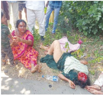
(వైరా/ఖమ్మం ప్రతినీధి-విజయం న్యూస్) చిన్నారికి అక్షరాభ్యాసం కోసం ఓ కుటుంబమంతా బాసర వెళ్లారు..సంతోషంగా గడిపారు.. చిన్నారికి అక్షరాభ్యాసం చేశారు.. తిరిగి ఇంటికి బయలుదేరారు.. మరో అరగంటలో తమ స్వగ్రామం చేరుకునే

వారు.. ఇంతలో ఊహించని ప్రమాదం.. అక్షరాలు నేర్చేందుకు వచ్చిన కుటుంబం ఒక్కసారిగా చిన్నాబిన్నమైంది.. వారి యమపాసం లారీ రూపంలో వెంటాడింది.. పినపాక స్టేజీ వద్దకు రాగానే ఊహించని ప్రమాదానికి గురైయ్యారు.. కారు నుజ్జునుజ్జైంది.. కారులో బెల్టాన్స్ ఒపెన్ అయినప్పటికీ మరణాన్ని అపలేరన్నట్లుగా మారింది.. అందరు కారులో ఇరుక్కున్నారు.. పోలీసుల శ్రమించి గాయపడిన వారిని బయటకు తీశారు.. ఈ ప్రమాదంలో తొలి అక్షరం రాసి, భావి భారత పౌరురాలు అవుతుందని అనుకున్న చిన్నారి అక్కడిక్కడే చనిపోయింది.. ఆమెతో పాటు ఆమె తల్లి, తాతా అక్కడిక్కడే చనిపోయారు. పాప తండ్రి తో పాటు కుటుంబ సభ్యులు తీవ్రంగా గాయపడ్డారు.. క్షతగాత్రులను