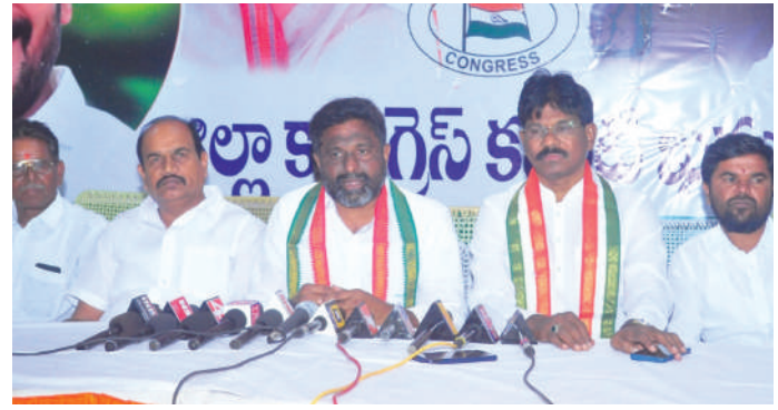
24గంటల విద్యుత్ సరఫరాపై