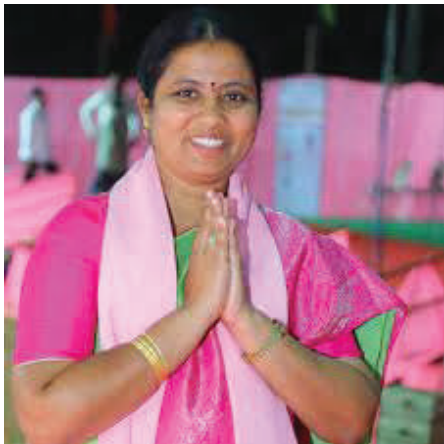
(ఇల్లందు -విజయం న్యూస్)

అనుకున్నదొక్కటి .అయ్యిందొకటి ,బి ఆర్ ఎస్ వ్యతిరేక వర్గం బోల్తా పడింది . ప్రస్తుత ఎమ్మెల్యేకు టికెట్ ఇస్తే పని చేయమని ఇదివరకే ప్రకటించారు. ఐదు మండలాల చెందిన కీలక నాయకులు రెండు రోజుల క్రితం సమావేశమయ్యారు. హరి ప్రియ టికెట్ ఇస్తే సహకరించమని సు స్పష్టం చేశారు. ఈ నేపథ్యంలో సీఎం కేసీఆర్ సిట్టింగ్ ఎమ్మెల్యేకి కేటాయించడం పట్ల ప్రముఖ వ్యతిరేక వర్గం ప్రజాప్రతినిధులు అంతా పెదవి విరుస్తున్నారు. గెలుపు ఓటమిల్లో వ్యతిరేక నాయకుల పాత్ర కీలకం