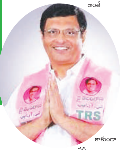
అంతే కాకుండా పది

బీజేపీ నేతల చూపు.. జలగం వైపు జలగం..? టచ్ లోకి వెళ్తున్న కేంద్ర, రాష్ట్ర స్థాయి బీజేపీ నేతలు ఆసర్లను ప్రకటించిన బీజేపీ కాంగ్రెస్ కు వెళ్లాలని కార్యకర్తల ఒత్తిడి ఆలోచనలో పడిన జలగం వెంకట్రావ్ రెండు రోజుల్లో కార్యాచరణ