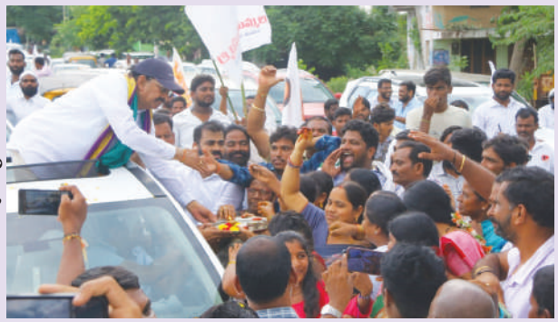
ఉంటానని హామినిచ్చారు. కొందరు