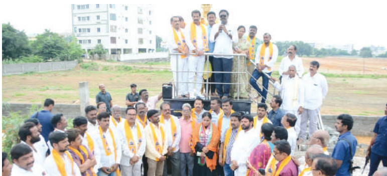
(ఖమ్మం ప్రతినిధి-విజయం న్యూస్)

రూ.2.95 కోట్ల అభివృద్ధి పనులకు శంకుస్థాపనలు చేసిన మంత్రి పువ్వాడ