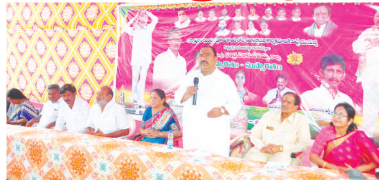
చేసి, తెలంగాణ లో పేదలకు అండగా అందుకున్న లబ్ధిదారులే మళ్లీ రాష్ట్రంలో ముఖ్యమంత్రి కెసిఆర్ ఉన్నారని, ప్రతి ఇంటికి ముచ్చటగా మూడోసారి ముఖ్యమంత్రిగా కేసీఆర్ ని గెలిపిస్తారని ఎమ్మెల్యే సంధ్ర అన్నారు. ఈ కార్యక్రమంలో డి.సి.ఎం.ఎస్ చైర్మన్

తెలంగాణ ప్రభుత్వం రాక ముందు 60 సంవత్సరాల నుంచి కాంగ్రెస్ పరిపాలించినప్పుడు ఈ 6 పథకాలు అప్పుడు గుర్తు రాలేదా? వాళ్లు అధికారం లో ఉన్న చోట పింఛన్ పెంపు కానీ, రైతు బీమా, రైతు బంధు, ఉచిత కరెంట్, ఏవి కూడ ఇవ్వకుండా తెలంగాణలో మాత్రం వచ్చి మేము అది చేస్తాం ఇది చేస్తాం అని అంటున్నారు. అలాంటి వాళ్లు మాయమాటలు నమ్మి ప్రజలు మోసపోవద్దు. తెలంగాణ ప్రభుత్వం వచ్చిన తర్వాత 60 ఏళ్ల కాంగ్రెస్ ప్రభుత్వంలో చెయ్యని పథకాలను