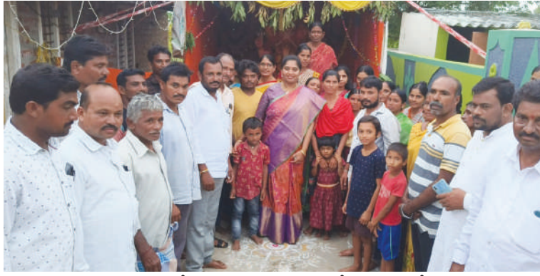
వద్దకు స్వయంగా వెళ్లి పూజలు చేసి రూ.10వేలను అందజేస్తున్నారు.

రూ.10వేల చొప్పున అర్థిక చేయూతనందిస్తున్నట్లు ప్రకటించడంతో పాటు ఆయన ఇప్పటికే వినియోగకర్తలకు వద్దకు వెళ్లి రూ.10వేలను కమిటీ బాధ్యులకు అందజేస్తున్నారు. వర్గాలకు, పార్టీలకు అతీతంగా ఆయన, వారి సతిమణి, కుమార్తెలు ఇద్దరు వేరువేరుగా ప్రతి గ్రామాల్లో పర్యటించి ఆయా మండపాల