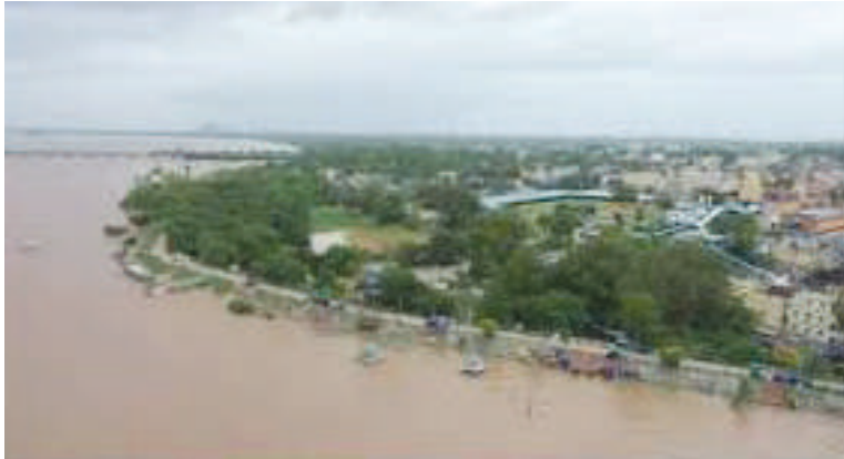
ప్రాణనష్టం చూడాల్సి వస్తుంది.. ఈ ఏడాది అత్యంత భారీగా 30 అడుగులకు పైగా వరదలు రావడంతో ముంపు ప్రాంతాలు మొత్తం నీటిమయం అయ్యాయి.. ఒక్క పలుకుతున్నారు.

(ఖమ్మం ప్రతినిధి-విజయం న్యూస్) రాష్ట్ర ఐటీ, పురపాలక శాఖమంత్రి, బీఆర్ఎస్ పార్టీ వర్కింగ్ ప్రెసిడెంట్, సీఎం కేసీఆర్ తనయుడు కల్వకుంట్ల తారకరామారావు శనివారం ఉమ్మడి ఖమ్మం జిల్లాలో పర్యటించనున్నారు. మంత్రి కేసీఆర్ తో పాటు రాష్ట్ర రోడ్డు అండ్ భవనాల శాఖమంత్రి వేముల ప్రశాంత్ రెడ్డి, రాష్ట్ర రవాణాశాఖ మంత్రి పువ్వాడ అజయ్ కుమార్, పార్లమెంటరీ పార్టీ నేత నామ నాగేశ్వరరావు, రాజ్యసభ సభ్యులు రవిచంద్ర, ఎమ్మెల్యేలు, ఎమ్మెల్సీలు పర్యటించనున్నారు. ఖమ్మం జిల్లాలో రూ.1350 కోట్ల నిధులతో నిర్మాణం చేస్తున్న అభివృద్ధి పనులకు మంత్రి కేసీఆర్ శంకుస్థాపనలు చేయనున్నారు.