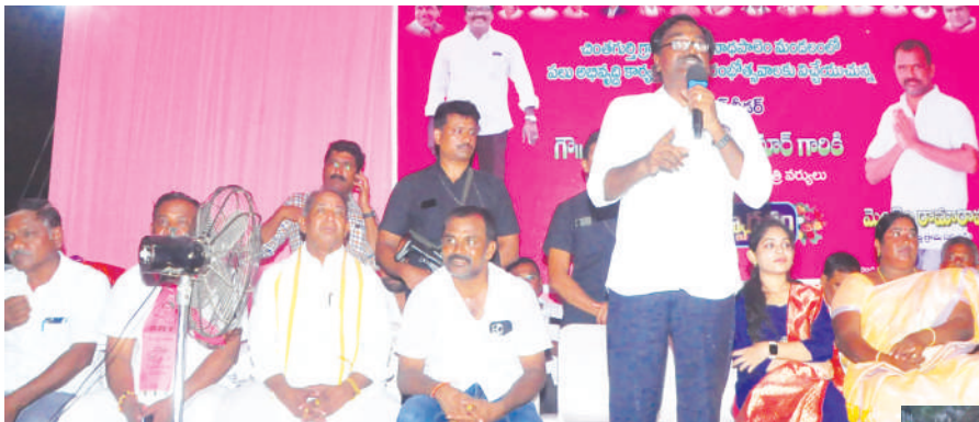
(ఖమ్మం ప్రతినిధి-విజయం న్యూస్)

- ఇంటింటికీ త్రాగునీరు అందించా - ప్రతి గ్రామంలో ప్రజలకు కావాల్సిన పనులు చేసి చూపించా - అభివృద్ధి ఎవరు చేశారో చూసి ఓట్లెక్కుండి - చింతగూర్చి నుంచి సూర్యతండాకు రోడ్డు బ్రడ్జి నిర్మాణ పనులకు శంకుస్థాపన చేసిన మంత్రి పువ్వాడ