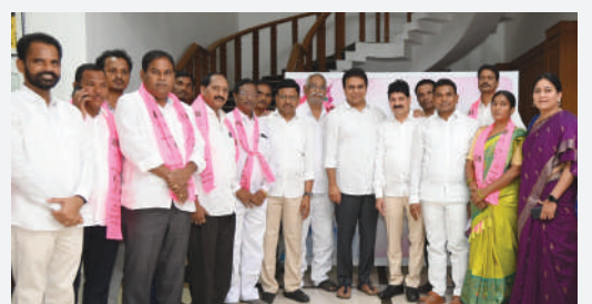
(భద్రాచలం-విజయంస్టూన్) రాజోయ్ ఎన్నికల్లో కాంగ్రెస్ పార్టీ అధికారంలోకి వస్తుందని అని గొప్పలు చెబుతున్న నాయకులకు ఆ పార్టీ ప్రజాప్రతినిధులు