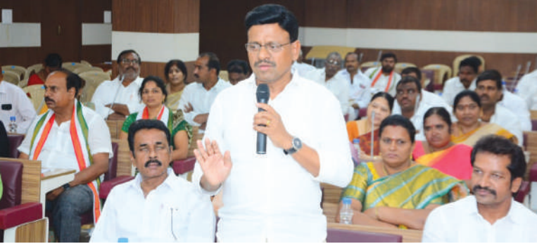
ఖమ్మం, సెప్టెంబర్ 6(విజయంన్యూస్):

సాధారణంగా ఖమ్మం నగరపాలక సంస్థ సర్వసభ్యమావేశం ఆందోళన చేపట్టిన కాంగ్రెస్ కార్యకర్తలకు అవినీతి అక్రమాలు జరుగుతున్నాయని ఆరోపించిన కాంగ్రెస్ కార్యకర్తలకు 22 అంశాలతో ఎజెండాను ఆమోదించిన పాలక సభ్యులు బీఆర్ఎస్ పాలనలోనే ఖమ్మం సర్వసభ్యమావేశం జరిగిందన్న తాతామధు