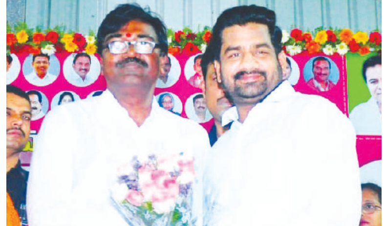
అని వారు ఆశాభావం వ్యక్తం చేశారు. ఈ ప్రధాన కార్యదర్శి మాటే బీఆర్ఎస్ తదితరులు కార్యక్రమంలో పాల్గొని యువజన విభాగం నగర పాల్గొన్నారు.