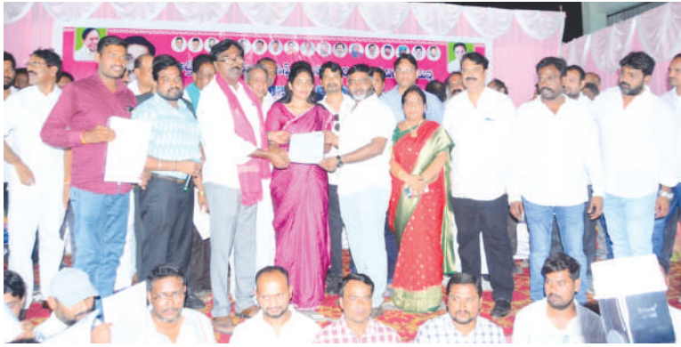
లైసెన్సులు ఇవ్వాలని ప్రతి నిత్యం అడిగేవారని, ఇప్పుడు 150 మందికి లైసెన్స్ లు ఇస్తుంటే సంతోషంగా ఉందన్నారు.