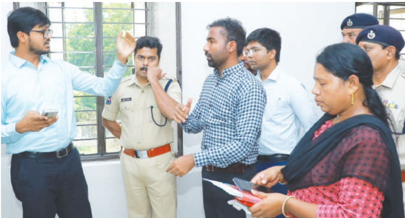
ఖమ్మం, అక్టోబర్ 19(విజయం న్యూస్):

బాలికల రెసిడెన్షియల్ పాఠశాల, కళాశాల భవనాలను పరిశీలించిన కలెక్టర్, సీపీ