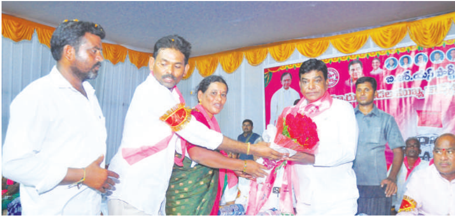
ఏన్నూరు, అక్టోబర్ 03(విజయం-స్టూన్):