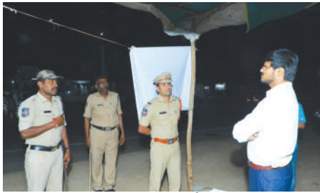
బెల్ట్ షాపులను తనిఖీ చేసి, సీజ్

చెక్ పోస్టుల వద్ద పకడ్బందీగా తనిఖీలు చేపట్టాలని జిల్లా కలెక్టర్ వి.పి. గాతమ్ అన్నారు. కలెక్టర్ ఆదివారం రాత్రి సుబ్బేడు క్రాస్ రోడ్ వద్ద ఏర్పాటు చేసిన అంతర్ జిల్లా చెక్ పోస్టు ఆకస్మిక తనిఖీ చేశారు. ఎంత మంది విధులు నిర్వహించుచున్నది, ఎన్ని వాహనాలు తనిఖీ చేసింది అడిగి తెలుసుకున్నారు. గూడ్స్ వాహనాలను తనిఖీ చేయాలని ఆయన తెలిపారు. నగదు, మద్యం రవాణా నియంత్రించాలన్నారు. వాహనాల తనిఖీ సంబంధించి రిజిస్టర్ ను నిర్వహించాలన్నారు. ప్రతి చెక్ పోస్టు లో వీడియోగ్రఫీ కి చర్యలు తీసుకోవాలని ఆయన తెలిపారు. 24 గంటల పటిష్ట నిఘా పెట్టాలని ఆయన అన్నారు.