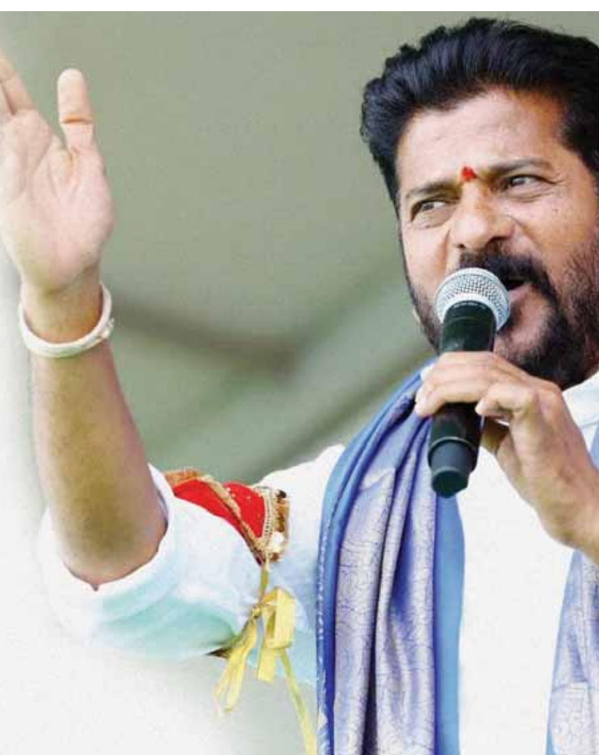
వీలుంది. ఈ నేపథ్యంలో ప్రచార పర్యాన్ని మూడు విడతలుగా చేపట్టాలని భావిస్తున్నట్లు పార్టీ వర్గాల ద్వారా తెలుస్తోంది. రాష్ట్రంలోని 17 పార్లమెంటు సీట్లకు గాను మూడు దఫాల్లో 14 ప్రాంతాల్లో పర్యటించేలా ప్రణాళిక రూపొందించినట్లు తెలిసింది. మధ్యలో జాతీయ నాయకులతో కూడా ప్రచారం చేయించే ఆలోచనతో ఉన్నారు.

లోక్సభ ఎన్నికలకు నోటిఫికేషన్ వెలువడిన నేపథ్యంలో పార్టీ ప్రచారాన్ని ముమ్మరం చేయడంపై ముఖ్యమంత్రి, టీపీసీసీ అధ్యక్షుడు రేవంత్ ప్రత్యేకంగా దృష్టి పెట్టారు. 14 సీట్లు గెలుచుకోవడమే లక్ష్యమని చెబుతున్న సీఎం అందుకు అనుగుణంగా ప్రణాళికలు సిద్ధం చేస్తున్నారు. లక్ష్యం మేరకు సీట్లను గెలుచుకోవడం ద్వారా పార్టీలో తన పట్టు నిరూపించుకోవాలనే పట్టుదలతో ఉన్నట్లు చెబుతున్నారు. వచ్చే నెల 13న పోలింగ్ నేపథ్యంలో 11వ తేదీ వరకు ప్రచారం నిర్వహించుకునే